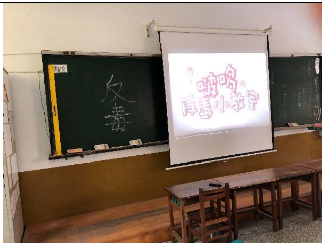
各班導師對學生進行藥物濫用宣導