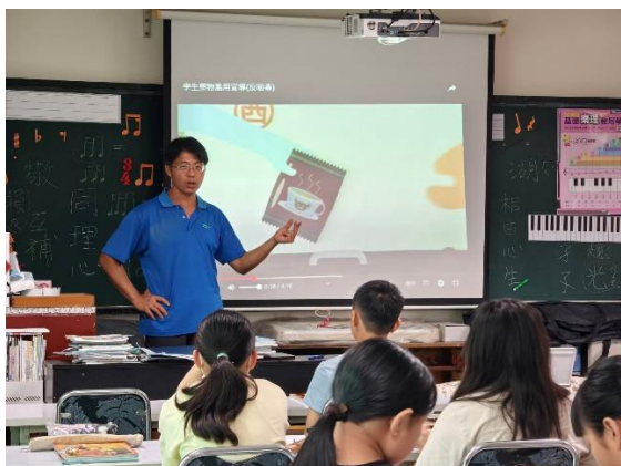
運用防毒守門員教材對學生進行宣導