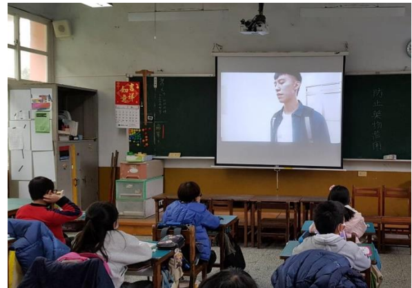
各班導師對學生進行藥物濫用宣導