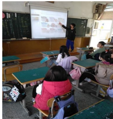
各班導師對學生進行藥物濫用宣導