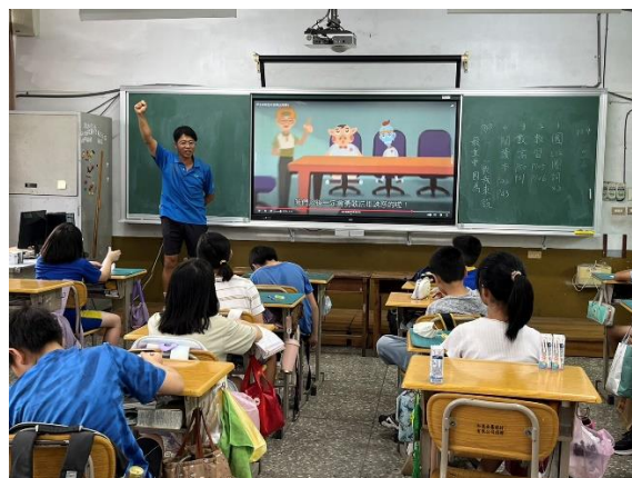
運用防毒守門員教材對學生進行宣導